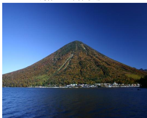
男体山・中禅寺湖