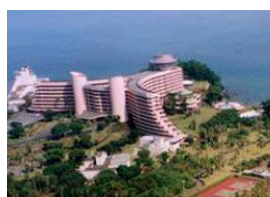
指宿いわさきホテル