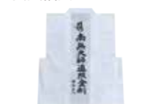
白衣袖無し [文字入]