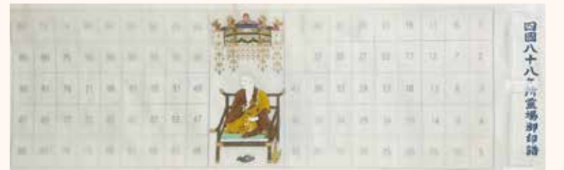
NO.6 龍光弘法 (額用)